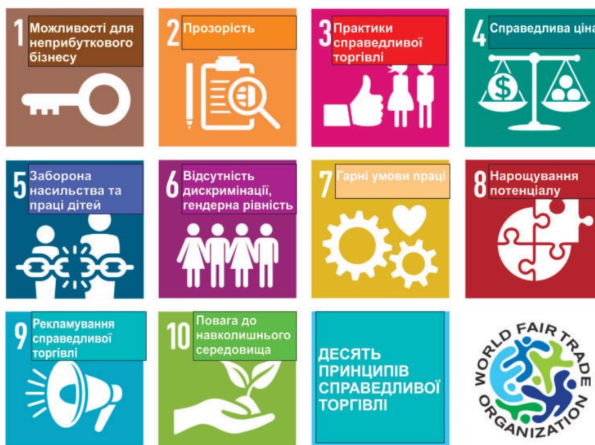
Рисунок 3 – Десять принципів справедливої торгівлі

Для цього в роботі проведено сегментування споживачів залежно від їх відношення до екології та екологічності, розглянуто основні мотиви споживання. Дослідження показують, що основним мотивом споживання екологічного одягу є турбота про здоров'я родини та власне здоров'я, трохи нижче в ієрархії знаходяться особливості еко-дизайну та турбота про стан навколишнього середовища. Саме ці мотиви необхідно використовувати при формуванні маркетингової політики у сфері еко-