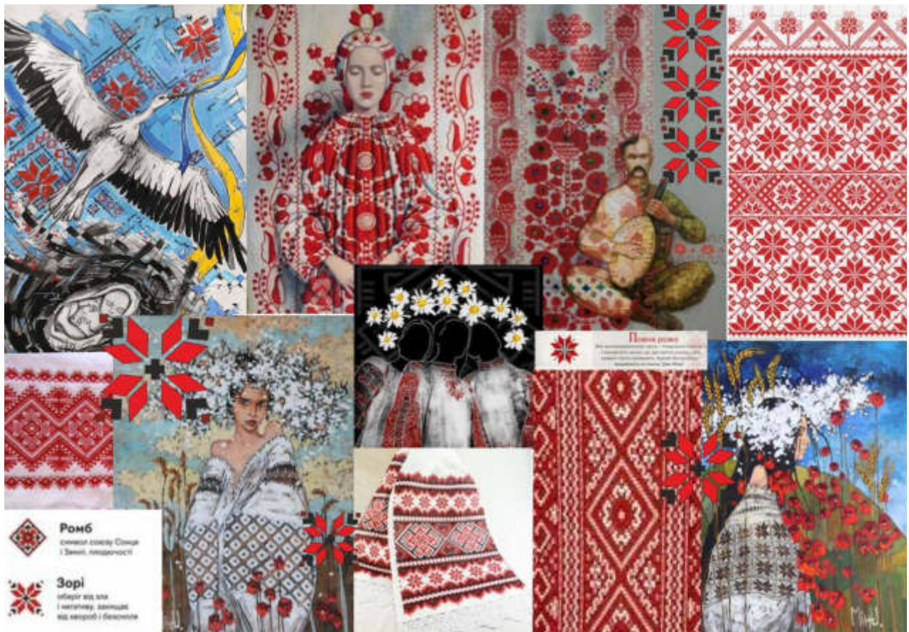
Рис. 2. MOOD BOARD «Український рушник»

Відомо, що творчий задум автора, на різних етапах, як проєктного так і виробничого процесу, найбільш доцільно представляють: пошуковий ескіз, фор-ескіз, творчий та технічний рисунок. Графічна манера та ступінь деталізації створюють особистий авторський стиль. На етапі ескізного проєктування відбувається остаточне наповнення форми, деталізація елементів та об'єднання окремих частин у цілісний структурний ансамбль одягу, взуття та аксесуарів.