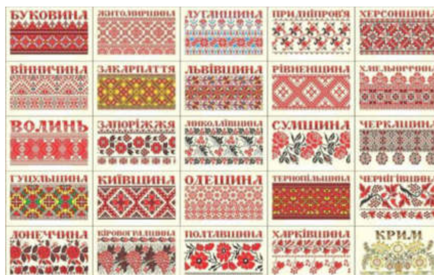
Рис. 1. Регіональна типізація крафтових національних візерунків [1]

української історії. У нашій країні вишитим рушникам завжди надавалося важливе образно-символічне значення. У візерунках відображаються культурна пам'ять народу, збережені давні магічні знаки, певний код та оберіг (образ «Дерева Життя»), кольорова символіка. Кожен регіон України може пишатися своїми унікальними вишитими рушниками, які відрізняються комбінуванням різних елементів, орнаментальних мотивів і візерунків, традиційних кольорів, технікою вишивання (рис. 1).