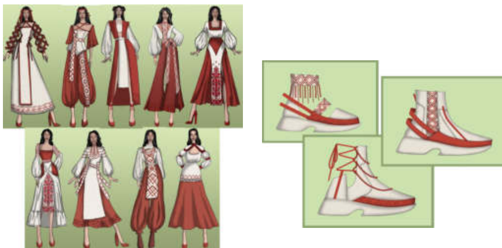
Рис. 4. Творча колекція «Український рушник»

трансформації орнаменту допомагають створити нові форми, текстури та образи. У цілому, використання національного орнаменту в дизайні творчої колекції жіночого одягу є дієвим засобом для створення