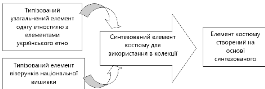
Рис. 4. Схематичне зображення творчого процесу отримання нових композиційних вирішень складових авторської колекції «Український рушник»

Творчий синтез нових дизайнерських рішень на основі типізованих елементів візерунків вишивки на українських рушниках Волинського регіону й типізованих рішень сучасного костюму дав змогу розробити ескізний ряд моделей одягу та взуття (рис. 4). Кожен образ колекції не лише відповідає творчому джерелу, а й тенденціям сучасної моди. Усі образи складається з прямокутних елементів, які відображають форми творчого джерела. А вишивка на рушнику – трансформується та прикрашає кожен образ. У всіх моделях є оздоблювальні елементи