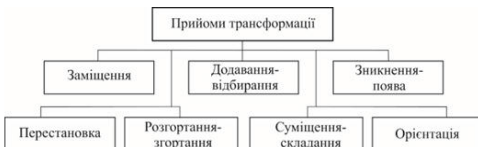
Рис. 11. Класифікація прийомів методу трансформації

В останній моделі використовується прийоми додавання-відбирання та перестановки, за допомогою яких декоративна деталь, що розташована знизу спідниці, та з'ємні рукави можуть прибиратися. Також в цій моделі використовується прийом орієнтації, який полягає в тому, що під декоративною деталлю розташована така ж сама деталь, на якій прикріплюються квіти з підсвіткою