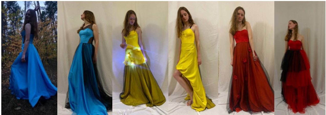
Рис. 14. Моделі вечірніх суконь-трансформерів до та після трансформації

або різних святкових подій. Для збільшення можливостей проєктування одягу, який може замінити декілька речей, були використані такі прийоми як перестановка, розгортання-згортання, зникнення-появи, орієнтації, додавання-відбирання, які є найбільш поширеними відповідно до аналізу напрямку моди. Використання прийомів трансформації і комбінаторики