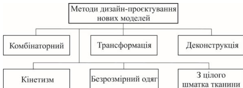
Рис. 1. Методи дизайн-проекткування нових моделей

Комбінаторика – це метод формоутворення, який заснований на пошуку, дослідженні та застосуванні