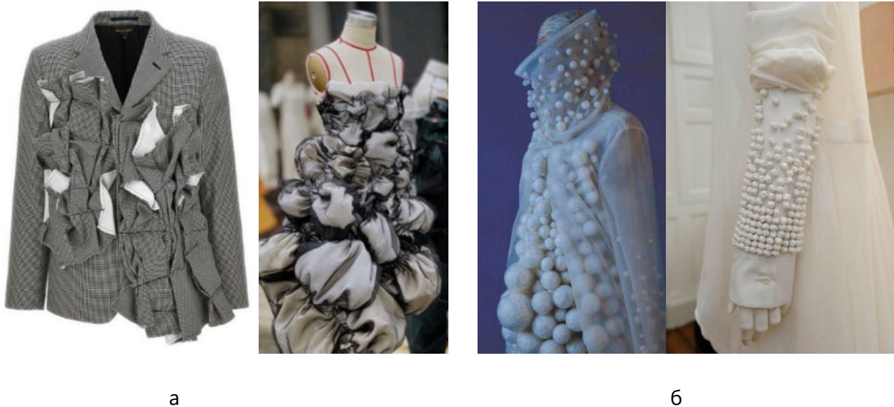
Рис. 4. Використання прийому: а – перестановок; б - організації ритму

Прийом вставок використовується для утворення складної форми з простої. Тобто на будь-якому виробі простого крою виконуються розрізи в будь-якому напрямку та вставляються плоскі елементи тканини простої або складної геометричної форми (у вигляді квітів,