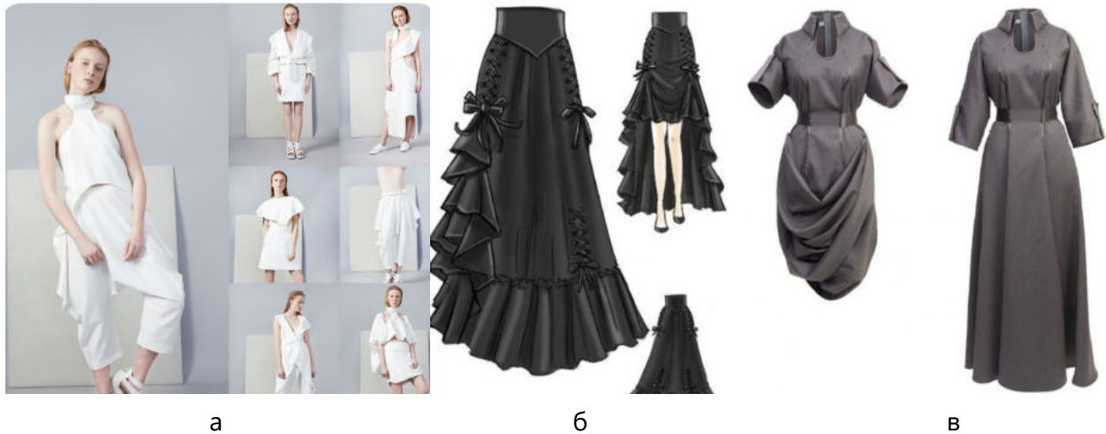
Рис. 9. Використання прийому: а - перестановки; б - зникнення-поява; в - суміщення-складання

кільком рухам. Методи комбінаторики та трансформації мають свої прийоми, які дозволяють досягти швидкої зміни зовнішнього вигляду завдяки використанню нових елементів. Класифікації прийомів вказаних методів, що можуть бути