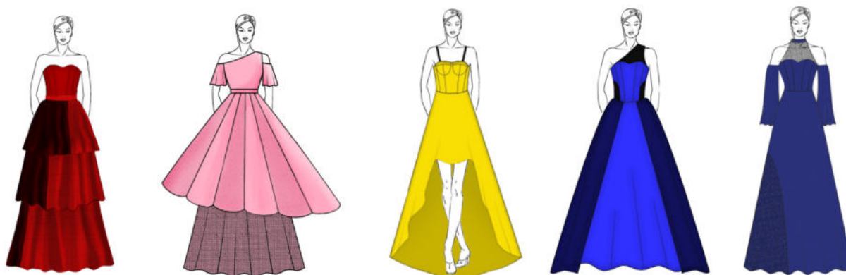
Рис. 12. Творчі ескізи вечірніх суконь (до трансформації)

зі сторони спинки, в результаті чого утворюється шлейф. При цьому відкривається внутрішня спідниця, яка до трансформації була схована під верхньою