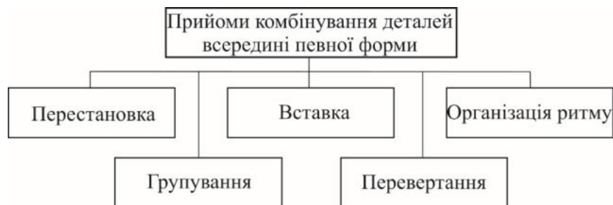
Рис. 3. Прийоми методу комбінаторики щодо комбінування деталей всередині певної форми

Комбінування деталей, пропорційних членувань всередині певної форми рекомендується виконувати на одній конструктивній основі або базовій формі. При розробці моделей використовують такі прийоми як перестановка, вставка, групування, перевертання та організація ритму (рис.3) [2-4].