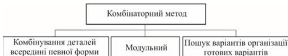
Рис. 10. Класифікація прийомів методу комбінаторики

приховуючи декоративні квіти. Конструкція спідниці розроблена з горизонтальним членуванням, яке розділяє її на коротшу верхню та довшу нижню частини. Завдяки такому підходу є можливість трансформувати виріб та приховати верхню деталь спідниці.