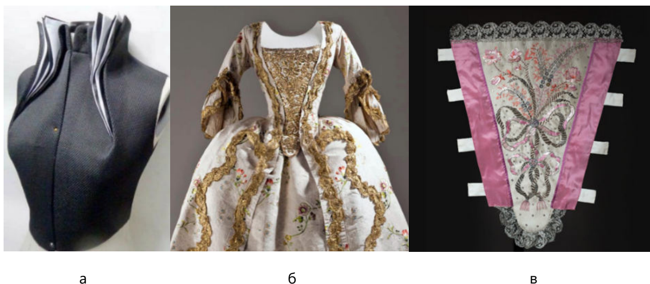
Рис. 5. Використання прийому вставок: а – сучасний виріб; б – історична сукня; в – стомак

листя, профілів, фігур людей тощо) (рис. 5, а). Прийом вставок має історичну основу. Відомо, що він почав використовуватися в період рококо. Тоді одним із обов'язкових компонентів жіночих суконь був стомак, а саме декоративна вставка для корсажу, що звужується донизу (рис. 5, б, в) [2, 7, 10].