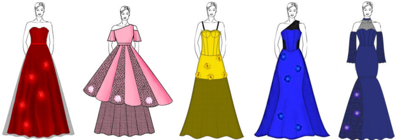
Рис. 13. Творчі ескізи вечірніх суконь (після трансформації)

Таким чином, для зміни зовнішнього вигляду моделей розробленої колекції були застосовані такі прийоми трансформації