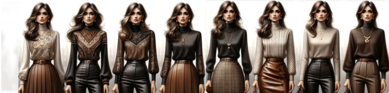
Рис. 6. Приклад прийому пошуку варіантів організації готових комплектів

результаті зміни таких морфологічних властивостей: топологічних, розмірних або конструктивних [3, 4]. Кожен з методів має свої прийоми та особливості застосування.